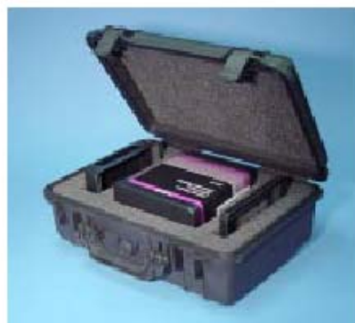
Phantom comes with detachable scanning wells and air tight case.